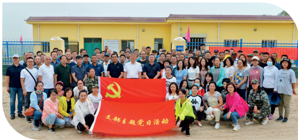
参加活动的全体党员合影